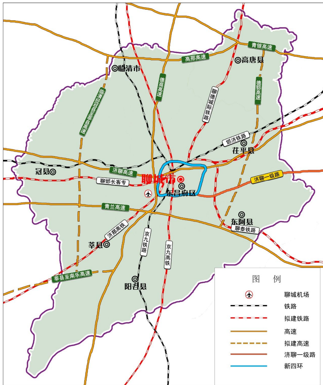
图 3-1 “十三五”时期综合交通布局示意图